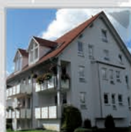
9 Einheiten, Kuppingen