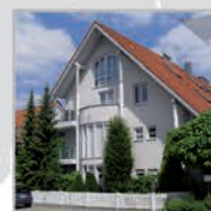
25 Einheiten, Nufringen