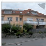
6 Einheiten, Nufringen