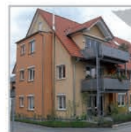
9 Einheiten, Hbg-Affstätt