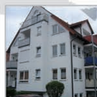
13 Einheiten, Sindelfingen