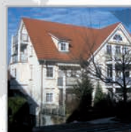
8 Einheiten, Bondorf