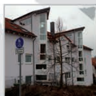
20 Einheiten, Magstadt