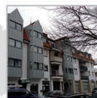
14 Einheiten, Sindelfingen