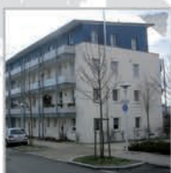
15 Einheiten, Herrenberg