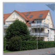
9 Einheiten, Herrenberg