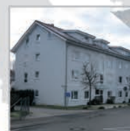
48 Einheiten, Herrenberg