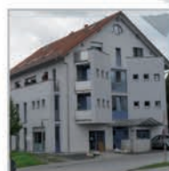
11 Einheiten, Herrenberg