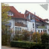
48 Einheiten, Nagold