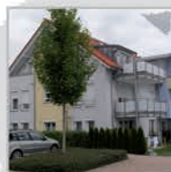
8 Einheiten, Nufringen