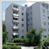
72 Einheiten, Ehningen