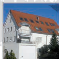
22 Einheiten, Bondorf