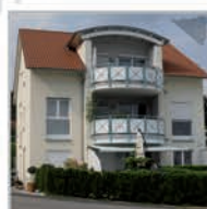
9 Einheiten, Herrenberg