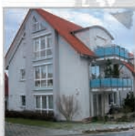
9 Einheiten, Haslach