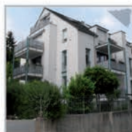
7 Einheiten, Herrenberg