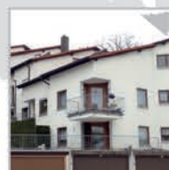
21 Einheiten, Weissach